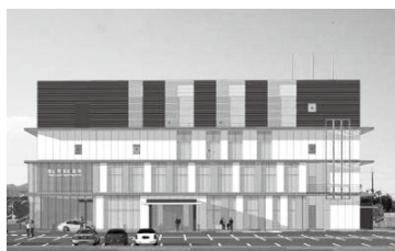
南区役所整備 (H25完成) 6.2億

東区区役所 6.5億 中区区役所 7.2億 学校耐震化 27億 足守小中校舎 12億 西部リサイクルプラザ 12億 コンベンション施設まで必要?