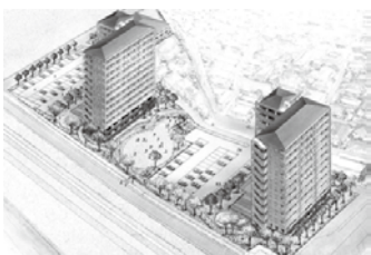
桜住座建替え1期 (H26完成) 4億