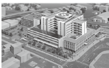
新市民病院建設 (H27完成) 〇〇億